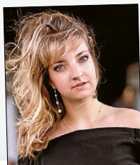
Lise de la Salle